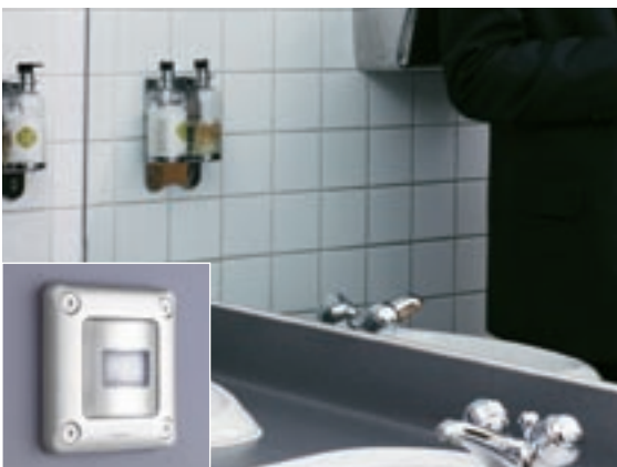
BAGNI PUBBLICI | Interruttore ad infrarossi passivi