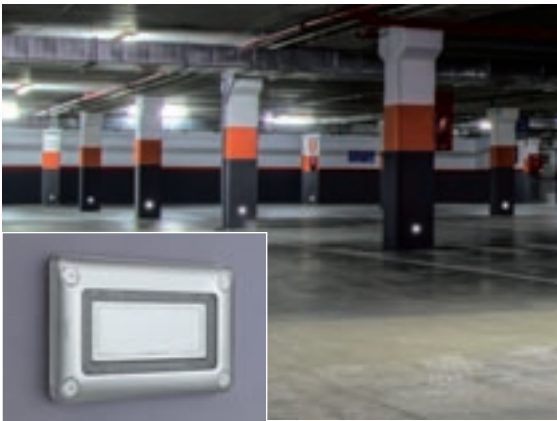
PARCHEGGI | Lampada segnapasso