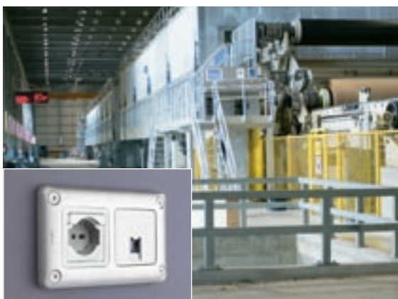
MAGAZZINI | Presa 2P+T + Connettore RJ 45