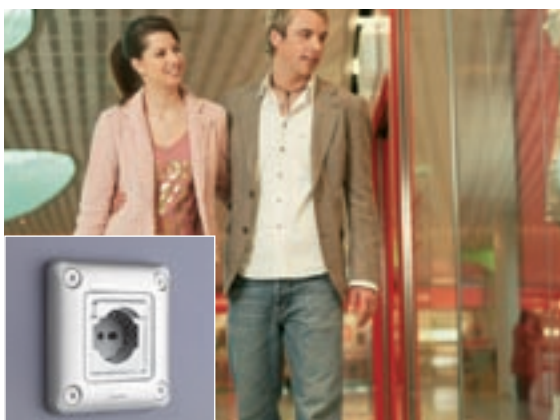
CENTRI COMMERCIALI | PRESA 2P+T