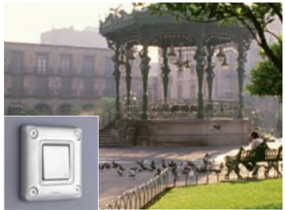
PARCHI E GIARDINI | Interruttore IP55