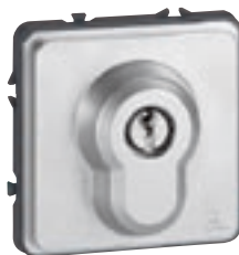
0778 74 + 069795