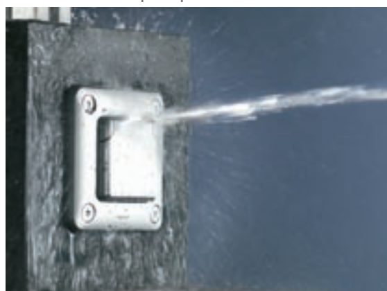
IP 55: IMPERMEABILITA' GARANTITA | Per i dispositivi destinati alla installazione all'aperto