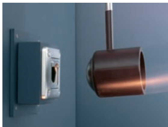
IK 10: MASSIMA RESISTENZA ALL'URTO | Tutti i prodotti possono reggere urti di 20 joule

Tutti i prodotti della linea Soliroc sono stati sottoposti a severi test per assicurare la massima sicurezza.