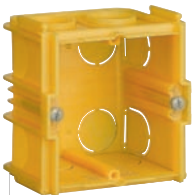
Scatola da incasso BTicino art. 502E

La linea Soliroc è facilmente combinabile con le scatole da incasso BTicino (art. 502E) o con le specifiche scatola superficiali. Ha tutti i vantaggi dell'esperienza e know-how Legrand, specialmente per quanto riguarda le installazioni controllate e semplificate.