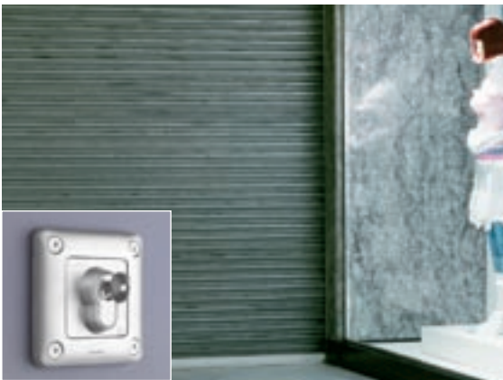
SERRANDE DI NEGOZI | Interruttore a chiave