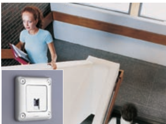
SCUOLE | Connettore RJ45