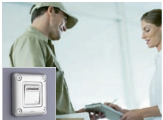
UFFICI | Pulsante con porta etichetta