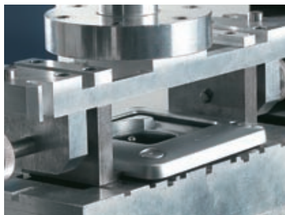
IK 10: MASSIMA RESISTENZA ALLA RIMOZIONE | Forma arrotondata della placca per evitare di afferrarla