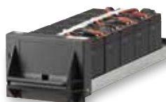
3 108 75